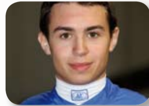
p4 Interview - Mickaël Barzalona, vainqueur du Derby d'Epsom