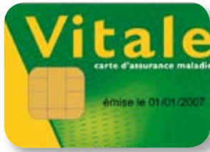
p3 Maladie, arrêt de travail : ce qu'il faut retenir